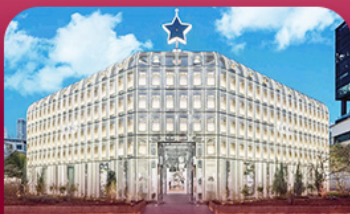
ย่านซองซู