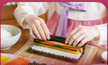
เรียงนำคิมบับ

สัมผัสเสน่ห์ฤดูหนาวของเกาหลีแบบอบอุ่นหัวใจพิเศษ! พักที่รีสอร์ท 1 คืน ท่ามกลางบรรยากาศหิมะขาวโพลน สนุกกับกิจกรรมฤดูหนาวยอดเยี่ยม ทั้งสกี สโนว์บอร์ดและสโนว์สไลด์ ก่อนออกเดินทางสู่เกาะนามิ ดินแดนแห่งความโรแมนติก ซิมสตรอร์วอร์รี่หวานซ่า สด ๆ จากฟาร์ม พร้อมเรียนทำคิมบับเมนูยอดฮิตสไตล์เกาหลี ปิดท้ายด้วยการช้อปปิ้งสุดฟินที่มีyeongdong และซองซู ย่านฮิตที่สายคาเฟ่และสายแฟชั่นห้ามพลาด