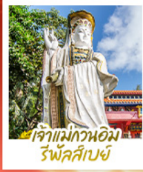
เจ้าแม่กวนอิมรัฟัสส์เบย์