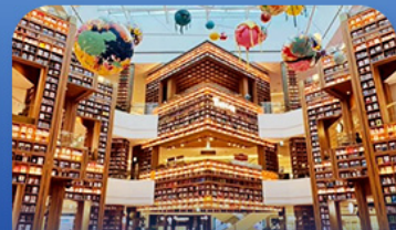
ห้องสมุดดิสตาร์ฟิค