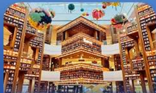
ต๋องกมุดคตาร์ทพีค