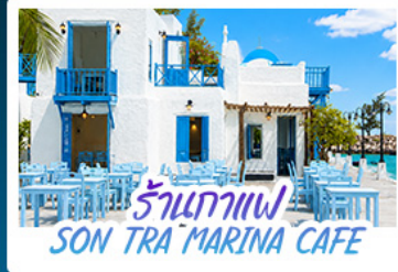
ร้านกาแฟ SON TRA MARINA CAFE