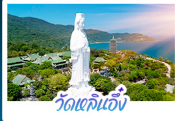
วัดเขลิ้นจี่