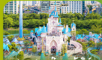
สวนสแกนดิเนเวีย Lotte Adventure World