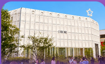
บรู๊กลินเกาเดิลี