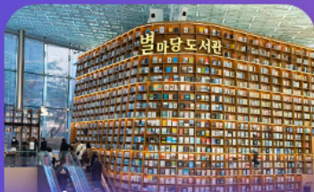
ห้องสมุดดิสตาร์ฟิลด์

เก็บทุกไฮไลท์ ในกรุงโซล ตั้งแต่ความงดงามของ พระราชวังเคียงบ็อก ชมวิวสุดอลังการที่ ดึงลิอเต้ โซลสกาย (รวมค่าลิฟต์ขึ้นดึก) สนุกสุดมันส์ที่ สวนสนุกลิอเต้ เวิร์ล (รวมค่าบัตรเครื่องเล่น) พลิดเพลินไปกับโลกใต้ทะเล ลีอเต้ อควาเรียม (รวมค่าบัตรเข้าชม) เช็กอินแลนด์มาร์กสุดฮิตอย่างห้องสมุดสตาร์ฟิลา โคเอกมอลล์ เดินเล่นย่านฮิป บริกสินทาหลี ซองชุง และช้อปปิ้งซัมเมอร์ซล สูดฟิน ย่านเมียงดงและฮงแด