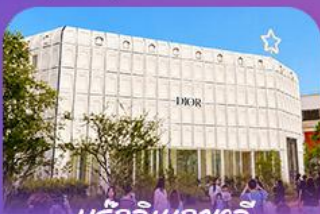
บรู๊กคินกาหลี