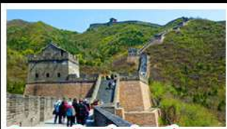
กำแพงเมืองจีนด้านจวิ้นกวน

บ๊อพิเศษ เปิดปักกิ่ง, สุกี่หม้อไฟ BUFFET