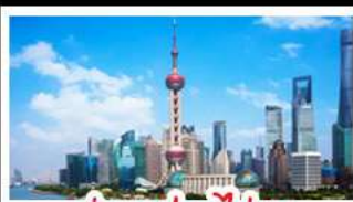
ถ่ายรูปไข่มุก