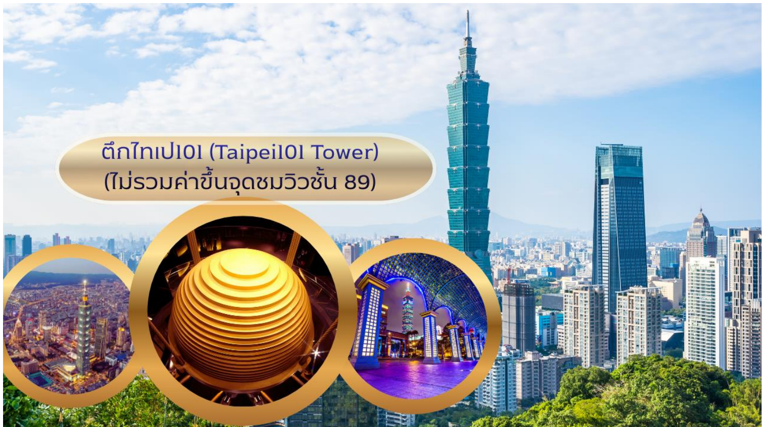
ตึกไทเป101 (Taipei101 Tower) (ไม่รวมค่าขึ้นจุดชมวิวชั้น 89)

อดีตยังคงสูงที่สุดในโลก ตึกไทเป 101 ยังคงความเป็นที่ 1 ไปได้คือลิฟต์ที่เร็วที่สุดในโลก ใช้เวลาขึ้นถึงชั้น 89 เพียงแค่ 37 วินาทีเท่านั้น (ไม่รวมค่าขึ้นจุดชมวิวชั้น 89) ** ท่านสามารถเลือกซื้อ Optional บัตรชม ตึกไทเป 101 วิวชั้น 89 ผ่านทางบริษัททัวร์ กรุณาแจ้งความประสงค์ ณ วันจองทัวร์ หรือแจ้งล่วงหน้าก่อนการเดินทางก่อนเดินทางอย่างน้อย 7 วันทำการ**