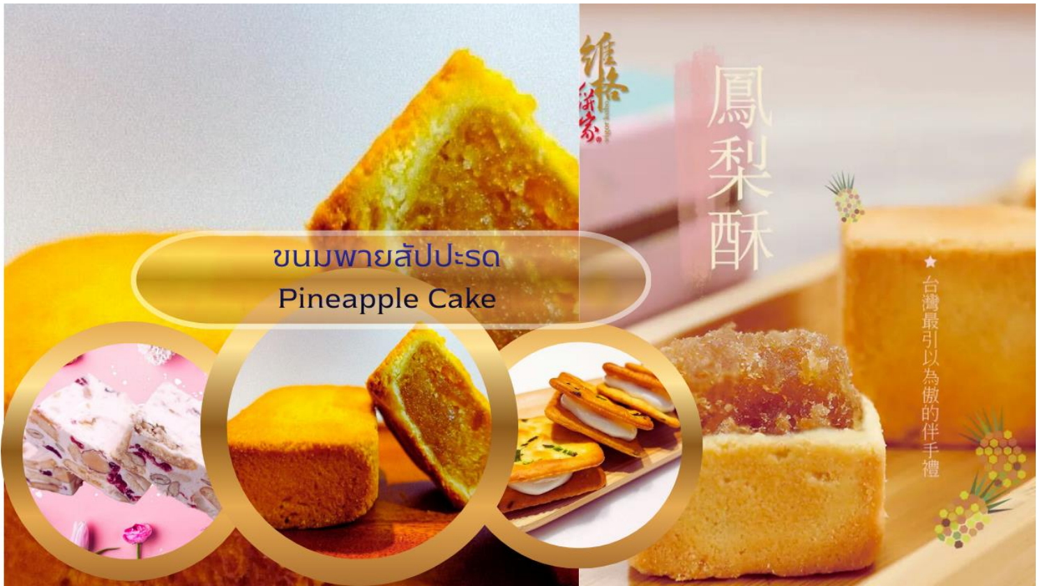
ขนมพายสับปะรด Pineapple Cake