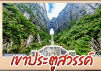
เขาประตูลั่วหวู่