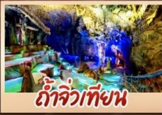
ถ้ำจิวเทียน