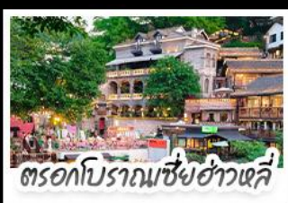
ตรอกโบราณเขี้ยวหัวลี่