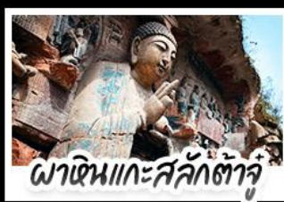
พาเดินแกะสลักคำจู้