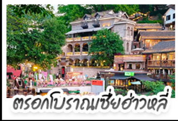
ตรอกโบราณเขี้ยวฮั่วหลี่