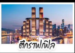
ตึกรูปไฟฟ้