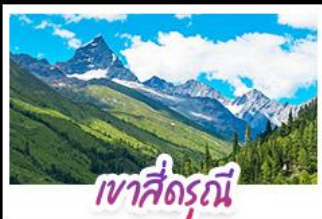
เขาสี่ดรุณี