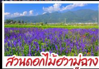
สวนดอกไม้ฮัวมู่ฉาง