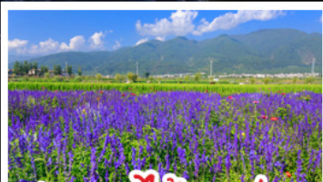
สวนดอกไม้ฮิวามู่ฉาง