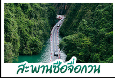
สะพานซื่อจื่อกวน