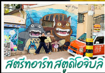
สตรีทอาร์ต สตุตโฮจิบลิ