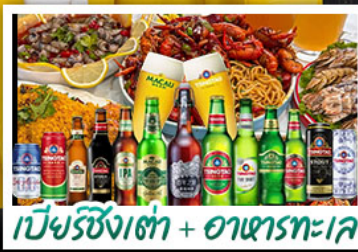
เบียร์ซิงเต่า + อาหารทะเล