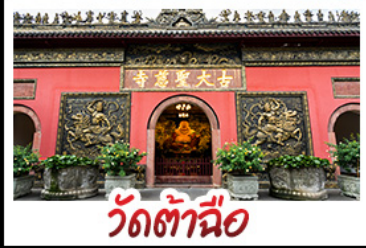
วัดต้าอื้อ