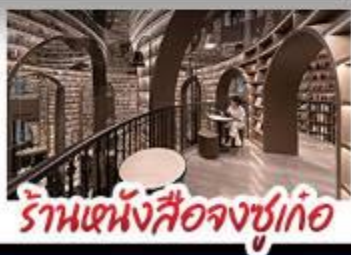
ร้านหนังสือจขู่เก๋

อุทยานภูเขาสี่ดรุณี อุทยานป่าเผิงโกว หนีแพนด้านอนเซลฟี ร้านหนังสือจขู่เก๋ วัดต้าฉือ ถนนโบราณความจำ ช้อปปิ้งย่านคิง ถนนไม้ไก่อู๋หลี่ + ถนนชุนซี้ซู่ เบบูฟิเศษ สุกี้หมาล่าเสอวน