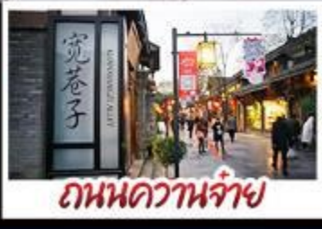
ถนนความจำ