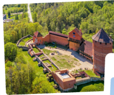
ปราสาทไครดา