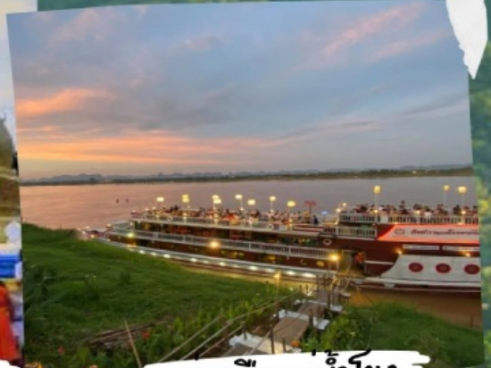
ล่องเรือแม่น้ำโขง