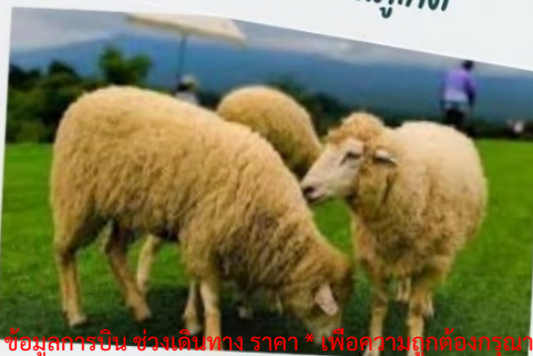
ฟาร์มแกะ