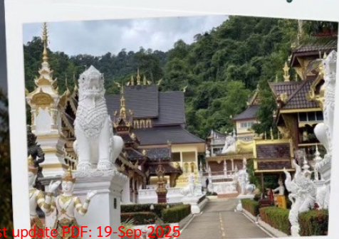
วัดจำเริญ