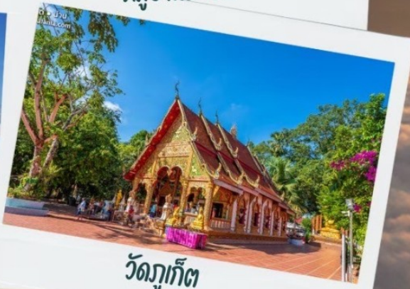
วัดภูเก็ต