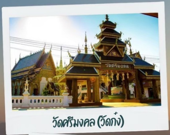
วัดศรีมงคล (วัดก่ง)