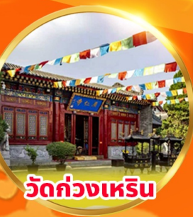
วัดกวางเหริน