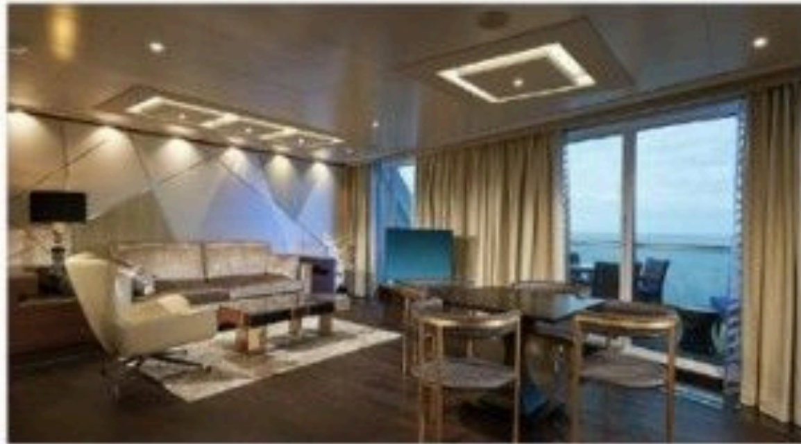
The Haven Deluxe Owner's Suite