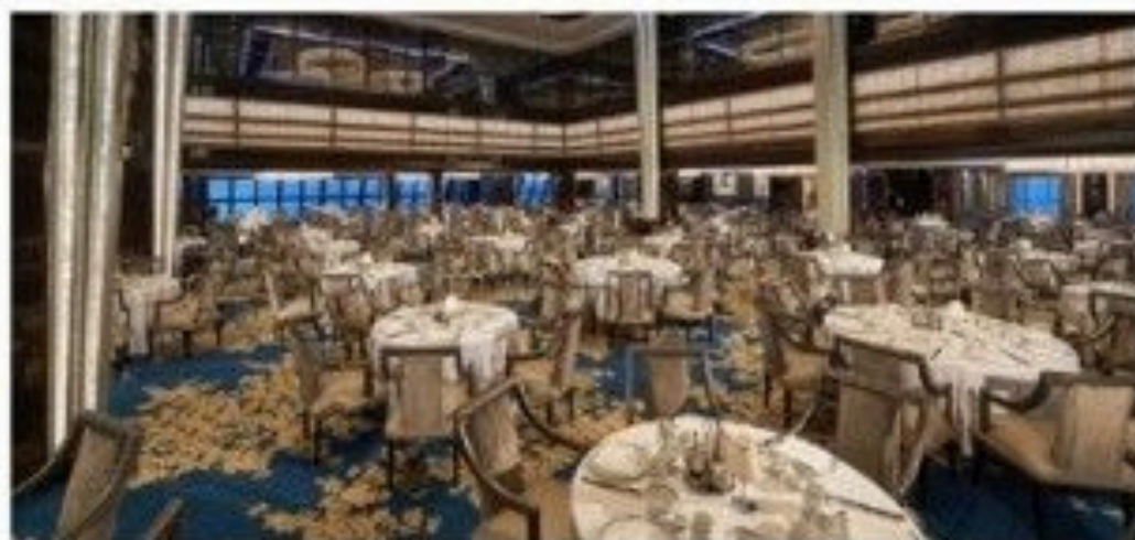
The Manhattan Room