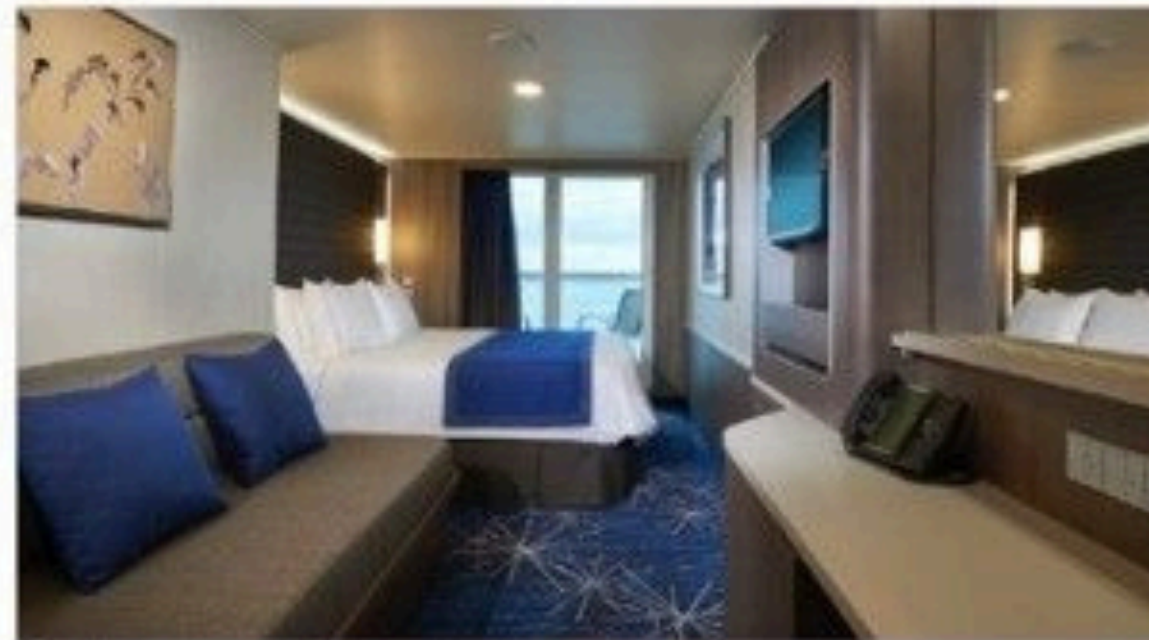
Club Balcony Suite