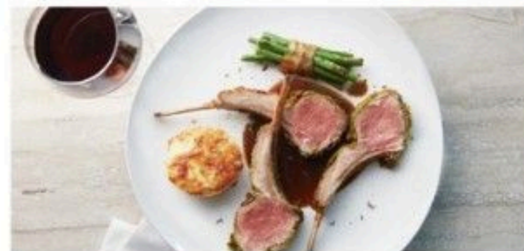
The Haven Restaurant