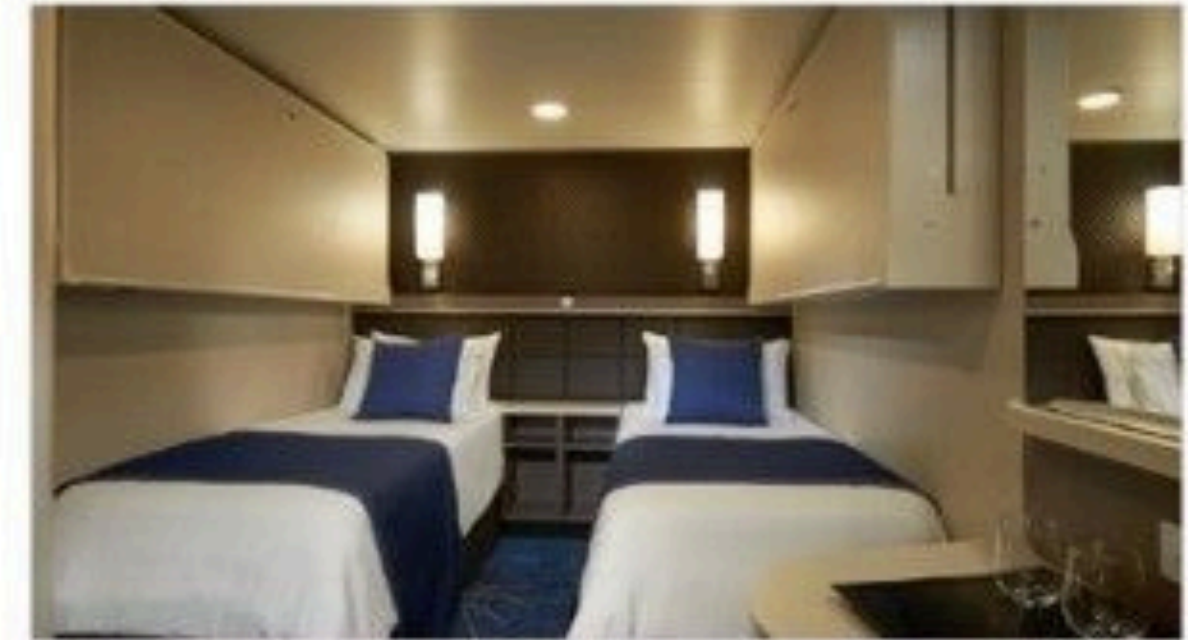
Family Inside Stateroom