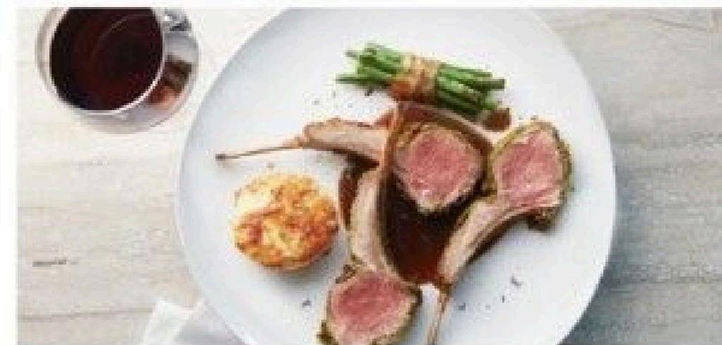
The Haven Restaurant