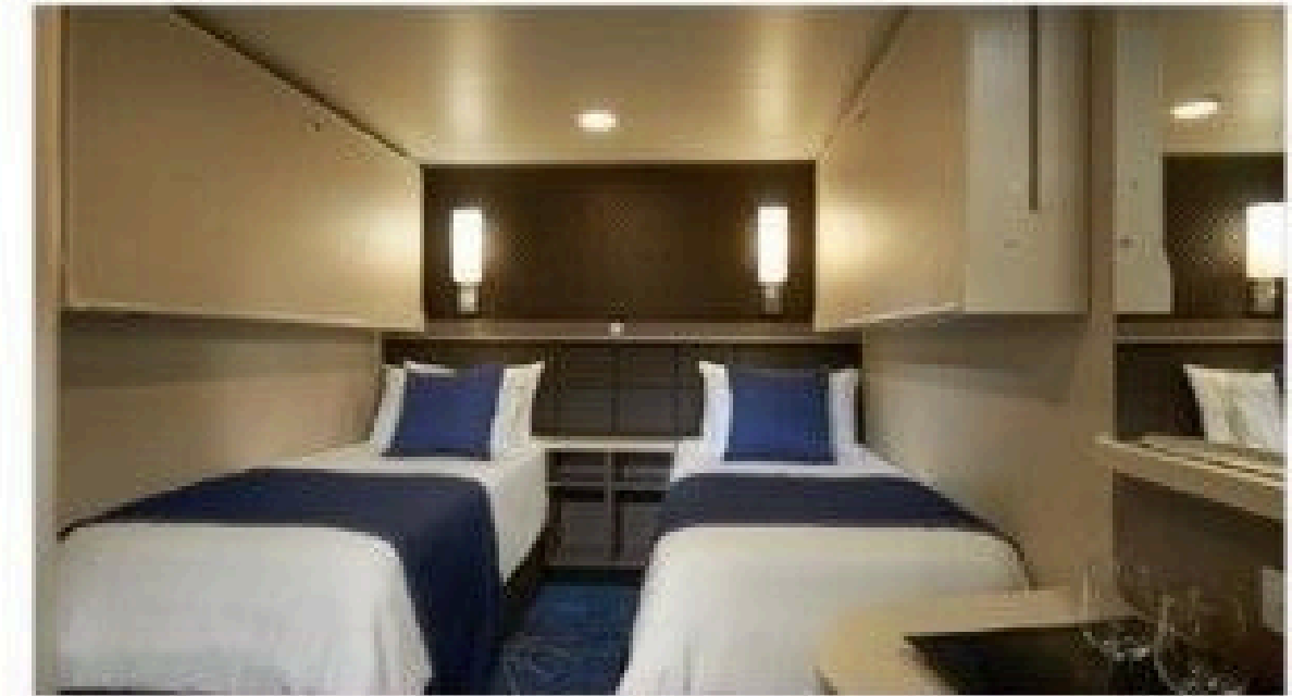
Family Inside Stateroom