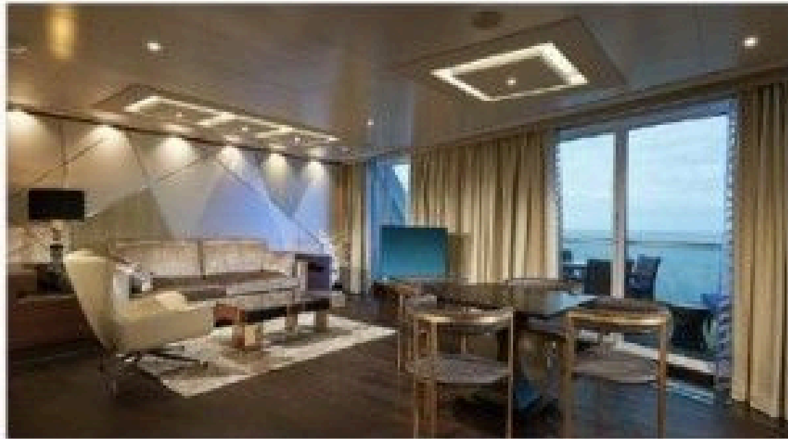
The Haven Deluxe Owner's Suite