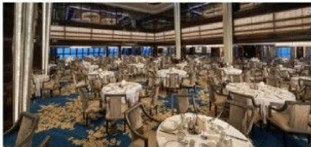
The Manhattan Room