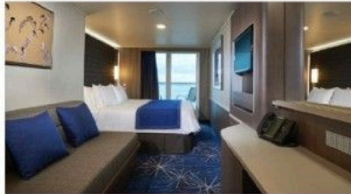
Club Balcony Suite