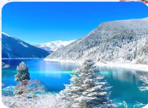
อุทยานจิวจ้ายโกว