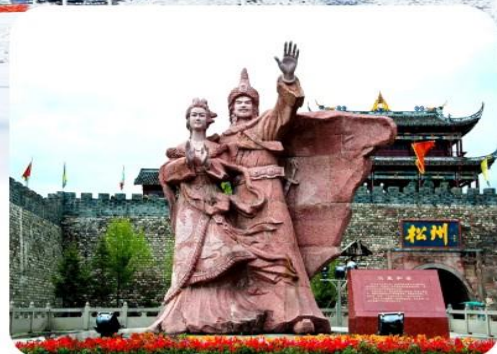
เมืองโบราณซงพาน

เมนูพิเศษ สุกี้หม่าล่า บุฟเฟต์ ดันตำรับเสฉวน