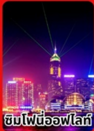
ชิมไฟนีอ้อฟโล่กั้

ราคาเดี่ยวเท่ี่ยวเก็นคู้ม 15,999 บาท/ท่าน