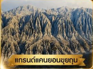
แกรนด์แคนยอนขุยถุน