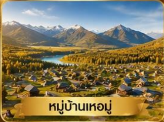
หมู่บ้านเหม่อมุ