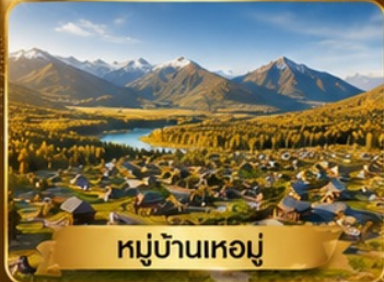
หมู่บ้านเหม่อ

อุหลุมู่จี • ธารน้ำห่าสี • แกรนด์แคนยอนขุยถุน • หมู่บ้านเหม่อ