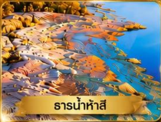
ธารน้ำห้ำสี่

อุหลุมู่จี • ธารน้ำห้ำสี่ • แกรนด์แคนยอนขุยถุน • หมู่บ้านเหม่อมุ