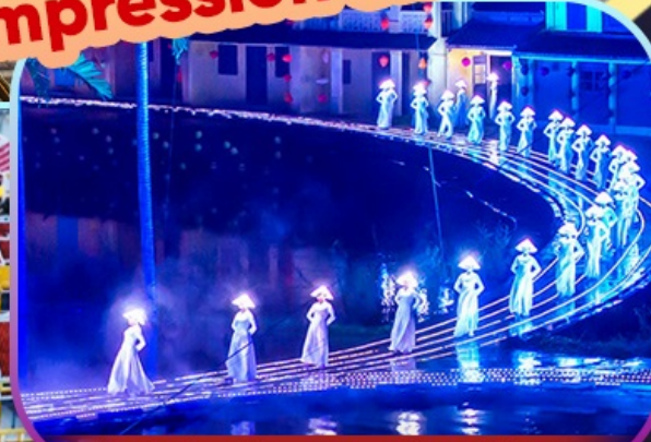
Hoi An Impression Show