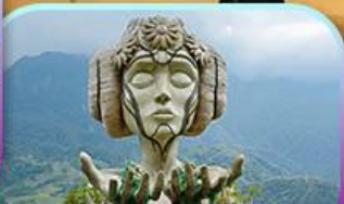
Moana Sapa Cafe