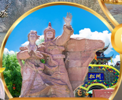
เมืองโบราณขงฟาน