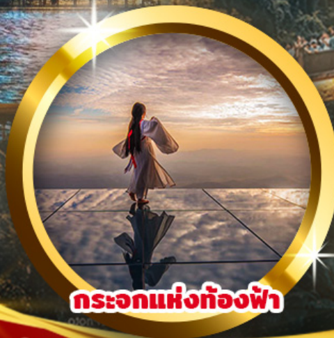
กระบอกแห่งท้องฟ้า