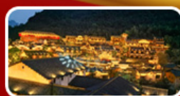
พักในหุบเขาเทวดา