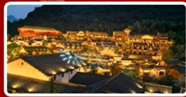
พักในหุบเขาเทวดา