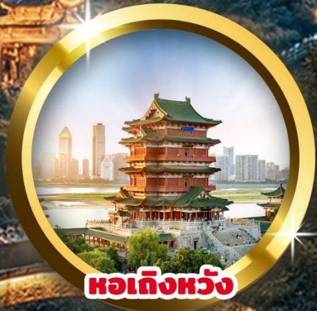
หอเท็งหวัง