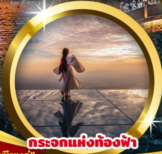
กระบอกแห่งท้องฟ้า