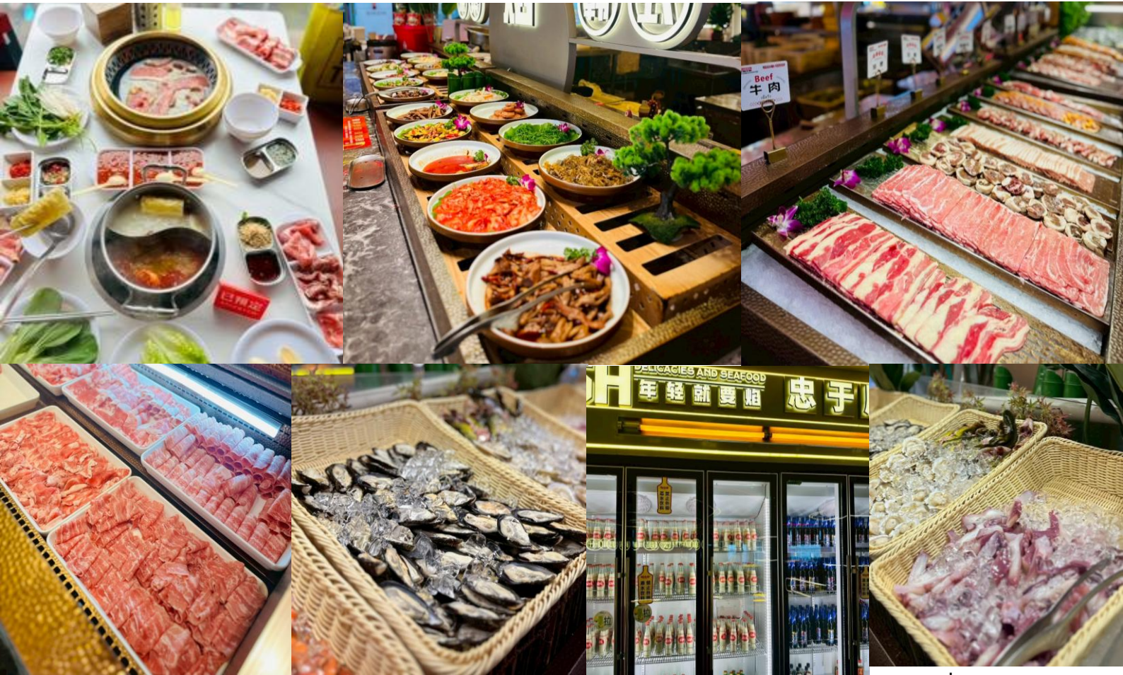
พั ก ที่ Changsha

เย็น รับประทานอาหารเย็น ณ ภัตตาคารพิเศษ..บุฟเฟ่ต์ซาบูหมาล่า (เสริฟไม่อันเปียร์,ไวน์)