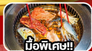
มือพิเศษ!!