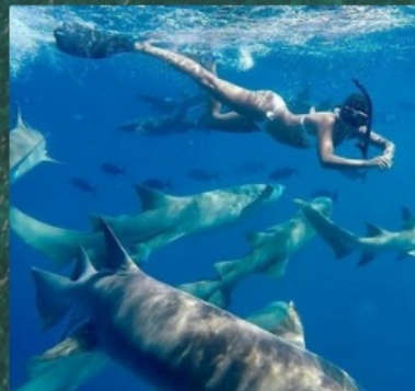
** Nurse Shark Snorkeling