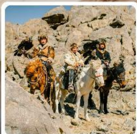
ชนเผ่ามองโกเลีย