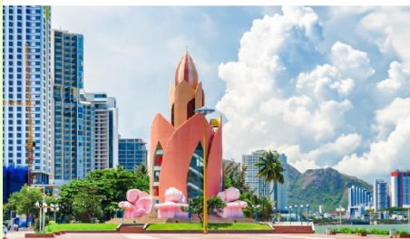
Tram Hung Tower