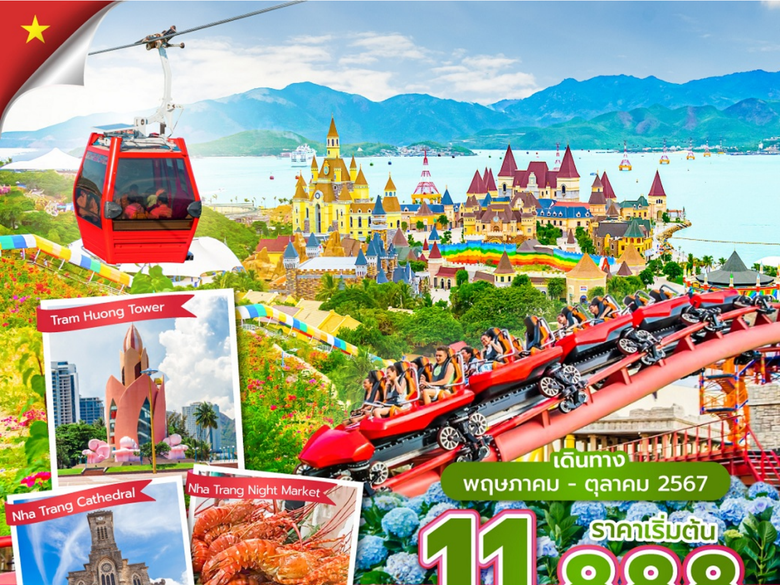
Tram Huong Tower