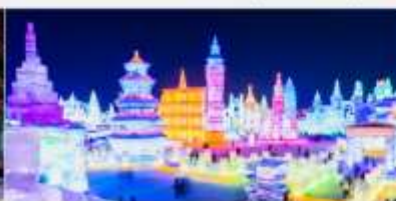
เทศกาลโคมไฟน้ำแข็ง