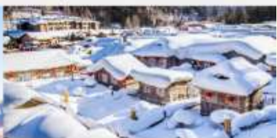
หมู่บ้านหิมะ

*ทางบริษัทฯ ขอสงวนสิทธิ์ในการสลับโปรแกรมทัวร์ตามความเหมาะสมขึ้นอยู่กับสถานการณ์หน้างาน โดยคำนึงถึงผลประโยชน์ของลูกค้าเป็นสำคัญ