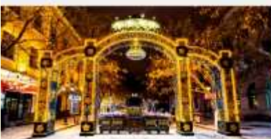
ถนนคนเดินจงหยาง