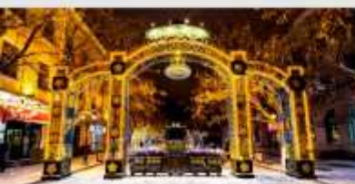
ถนนคนเดินจงหยาง