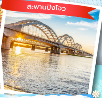
สะพานปิงโหว