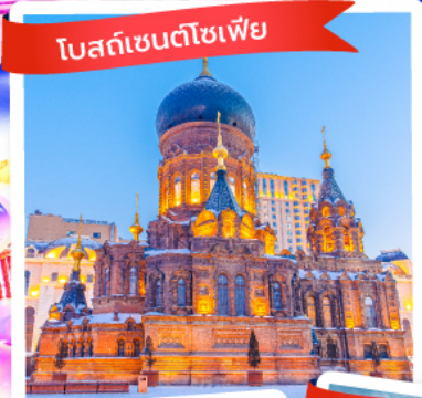
โบสถ์เซนต์โซเฟีย