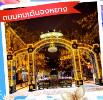
ถนนคนเดินจงหยาง