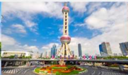
วงเวียนหมิงจู่