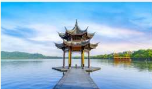
ทะเลสาบซีหู