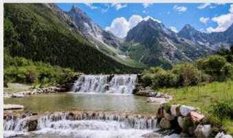
อุทยานแห่งชาติปี่เฟิงโกว