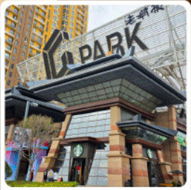
ห้าง G Park