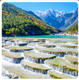
ทะเลสาบไป๋ส่วยเหอ