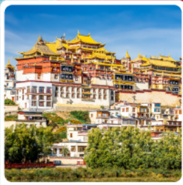
วัดลามะซงจ้านหลิน