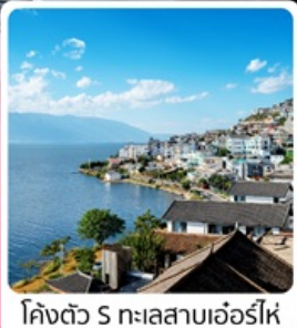
โคงตั่ว 5 ทะเลสาบเอ๋อร์ไห่