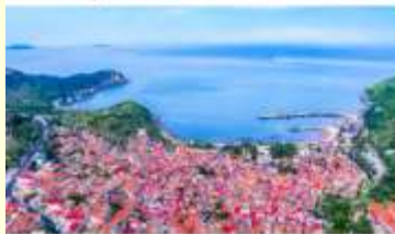
หมู่บ้านชาวประมง