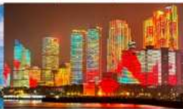
อ่าวฟู่ซาน