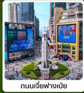
ถนนเจี๋ยฟางเป่ย์