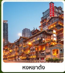
หงหยาดต้ง