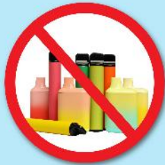
ปืนไฟฟ้า บุหรี่ยุติไฟฟ้า