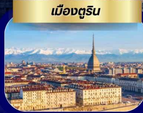
เมืองตูริน

เที่ยว 3 ประเทศ ฝรั่งเศส สวิตเซอร์แลนด์ อิตาลี เส้นทางยุโรปยอดนิยม ปารีส หอไอเฟล ประตูชัย พิพิธภัณฑ์ลูฟร์ ล่องเรือบาโตมูช ชมวิวปารีสบนสายน้ำ เจนีวา นาฬิกาดอกไม้ น้ำพุเจดโด่ เมืองโลซานน์ ศาลาไทยแห่งเมืองโลซานน์ เมืองเซอร์แมท หมู่บ้านโรัดยนต์ ชมวิวยอดเขาแมทเธอร์ฮอร์น เมืองซียง เมืองตูริน มหาวิหารตูริน เมืองมิลาน ดูโอโมแห่งเมืองมิลาน ช้อปปิ้ง SERRAVALLE OUTLET