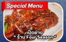
เปิดอย่าง "ร้าน Four Season"