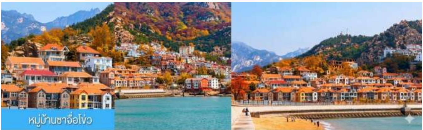
หมู่บ้านซาจื่อโ้ว

พักที่ WEIHAI BOYUE HOTEL / WEIHAI JIANGUO PUYIN โรงแรมระดับ 4 ดาวท้องถิ่นเมืองเวย์ไห่