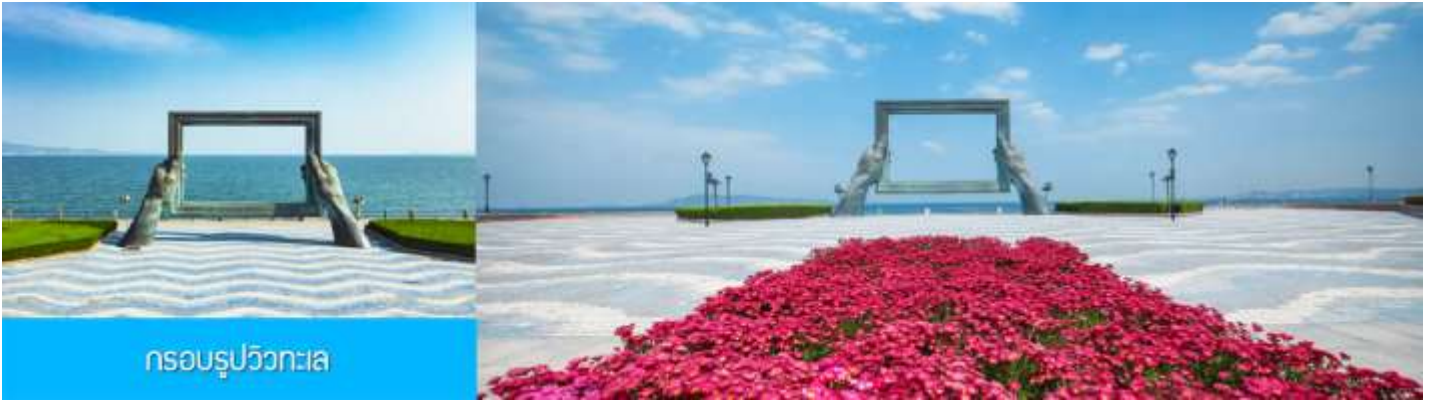
กรอบรูปวิวกทะเล

นำท่านชมและถ่ายภาพคู่กับ กรอบรูปยักษ์วิวกทะเล 威海公园大相框 แลนด์มาร์คที่เป็นอีกหนึ่งไฮไลท์ฮิตของเมืองเวย์ไห่