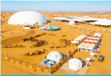
เกาะกลางทะเลทรายเขียนซาเต่า