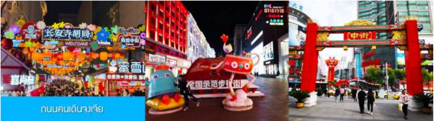
ถนนคนเดินวเวียง