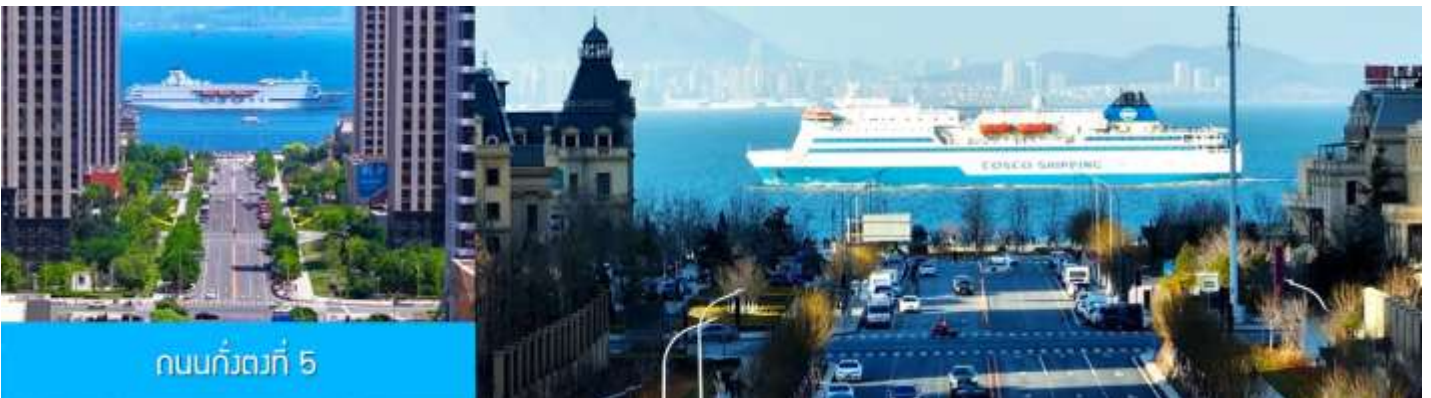
ถนนกั๋วตงที่ 5