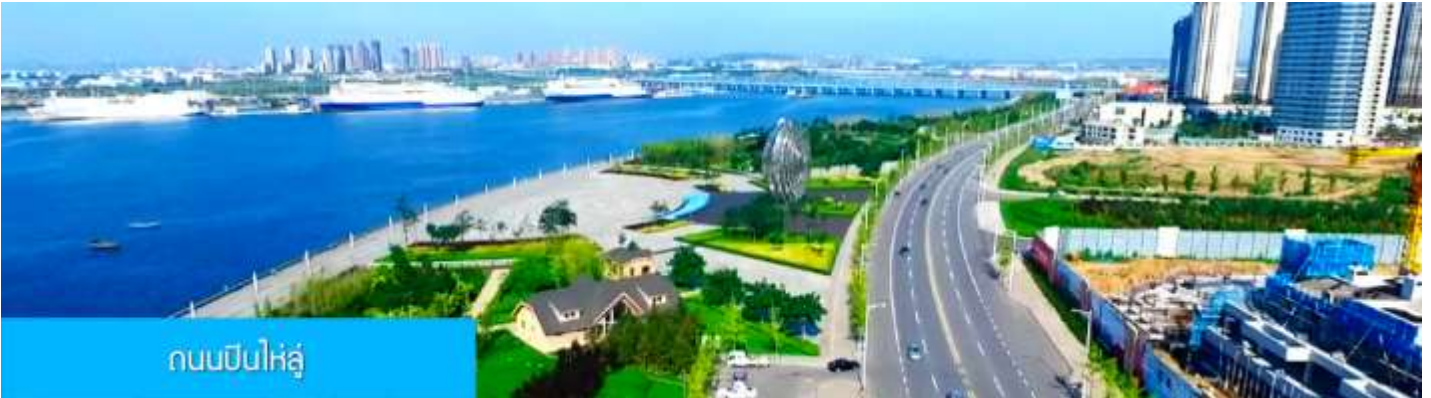
ถนนปินไห่หลู่

ล้อมด้วยตึกระฟ้าที่ทันสมัย ภายในมีบ่อน้ำพุดนตรี ลานหญ้าขนาดใหญ่ และลานกว้างสำหรับจัดกิจกรรม กลางแจ้ง อาทิ เทศกาลเบียร์นานาชาติ การแข่งขันวิ่งมาราธอน งานแฟชั่นนานาชาติเมืองต้าเหลียน ฯลฯ