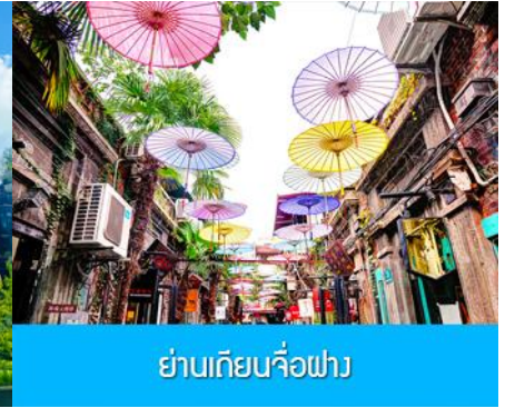
ย่านเทียนจื่อผา