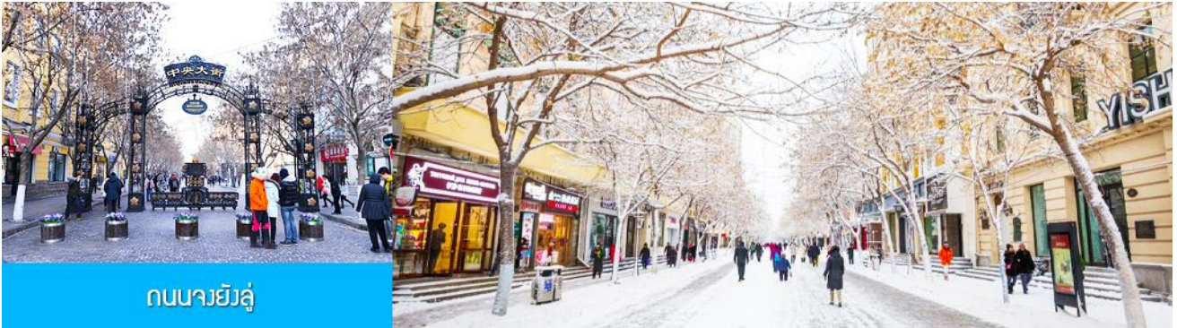
ถนนมายี่ลู่

เที่ยง รับประทานอาหารกลางวัน ณ ภัตตาคาร (2) หลังอาหารนำท่านชม อนุสาวรีย์ฝังหง 防洪纪念碑 อนุสรณ์ของชาวเมืองฮาร์บินที่ถูกจารึกในประวัติศาสตร์ในการเอาชนะอุทกภัยธรรมชาติครั้งใหญ่ในปี ค.ศ. 1957