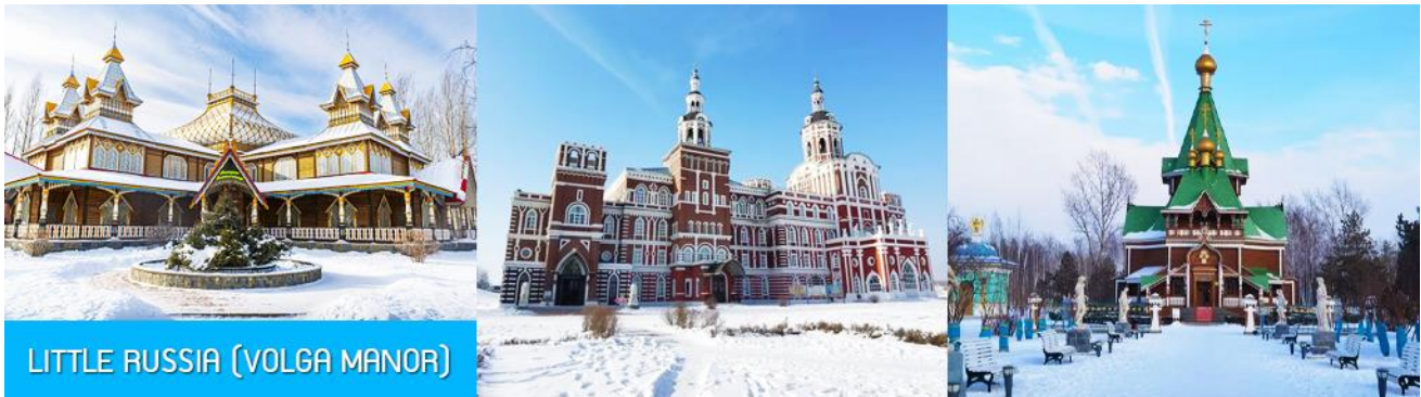
LITTLE RUSSIA (VOLGA MANOR)

จากนั้นนำท่านเที่ยวชม สวนคฤหาสวอลก้า LITTLE RUSSIA (VOLGA MANOR) 伏尔加庄园 สวนคฤหาสน์ที่ออกแบบคล้ายพระราชวังสไตล์รัสเซียในยุคกลาง บนเนื้อที่กว่า 600,000 ตารางเมตร แหล่งท่องเที่ยวระดับ 4A และเป็นศูนย์แลกเปลี่ยนทางวัฒนธรรมจีนและรัสเซีย อาคารทุกหลังภายในสวนแห่งนี้ล้วนถูกออกแบบอย่างปราณีตโดยสถาปนิกชาวรัสเซีย ประกอบด้วยอาคารและคฤหาสน์ หรัสสไตล์รัสเซีย ที่โดดเด่นด้วยเอกลักษณ์ อาทิ วิหาร โรงแรม ภัตตาคาร พิพิธภัณฑ์ศิลปะ โบสถ์คริสต์ออร์โธด็อกซ์ โรงเหล้าวอดก้า ฯลฯ ที่แวดล้อมด้วยต้นไม้ สวนหย่อม ธารน้ำ สะพานไม้ เป็นแหล่งท่องเที่ยวสไตล์รัสเซียที่มีมุมเก็บภาพและจุดเช็คอินเก๋