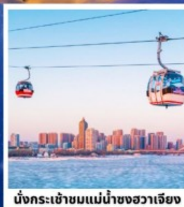
นั่งกระเช้าชมแม่น้ำซงฮวาเจียง