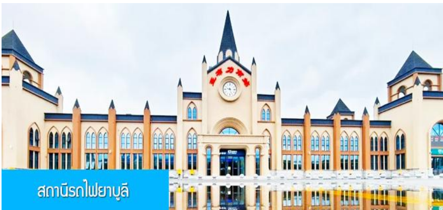
สถาปัตยกรรมไฟยาบูลี

หมายเหตุ เพื่อความสะดวกในการเข้าพักใน HOME STAY ภายในหมู่บ้านหิมะ ทางทัวร์แนะนำให้ท่านจัดเตรียมเสื้อผ้าและเครื่องใช้เท่าที่จำเป็น 2 ชุดใส่กระเป๋าใบเล็กหรือเป้แบบสะพายได้ เพื่อสะดวกในการนำติดตัวไปใช้สำหรับคืนที่นอนในหมู่บ้านหิมะ หากนำกระเป๋าเดินทางใบใหญ่เข้าสู่ที่พักในหมู่บ้านอาจสร้างความไม่สะดวกแก่ท่าน จึงไม่แนะนำ