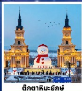
ตึกตาสหิมะยักษ์