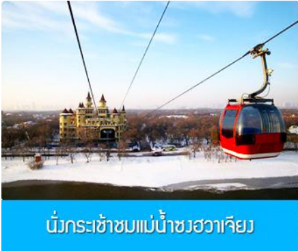
นั่งกระเช้าชมแม่น้ำซวงเวาเจียง

พักที่ VIENNA INTER HOTEL โรงแรมระดับ 4 ดาวท้องถิ่น ในเมืองเมืองซ่งจื่อ